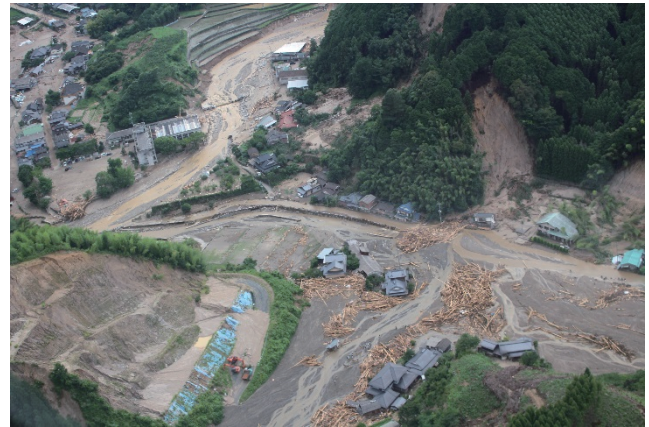
朝倉市松末地区の被害状況