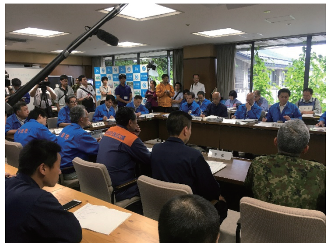
消防応援活動調整本部（大分県庁）

福岡市消防局指揮支援隊は、大分県庁に設置された消防応援活動調整本部に部隊長の属する指揮支援隊として参集し、大分県、大分県内消防本部及び消防庁派遣職員のほか、警察、自衛隊、海上保安庁、DMAT、気象庁、国土交通省等の関係機関とも連携し、被害情報の収集・整理、緊急消防援助隊の活動管理等を行った。また、二次災害の発生を防止するため、降雨による活動中止判断の基準を明確にし、指揮支援隊長を通じて各県大隊長に周知した。