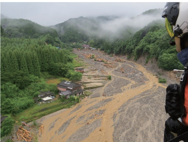
上空からの偵察活動

こうした緊急消防援助隊の活動は、7月6日から7月25日までの20日間にわたり行われ、出動隊の総数は、1府11県（愛知県、大阪府、兵庫県、奈良県、