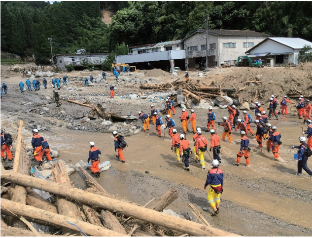
河川の一斉搜索の状況

また、筑後川流域や有明海においても、地元消防機関、警察及び自衛隊と連携し、大規模な一斉搜索を実施した。