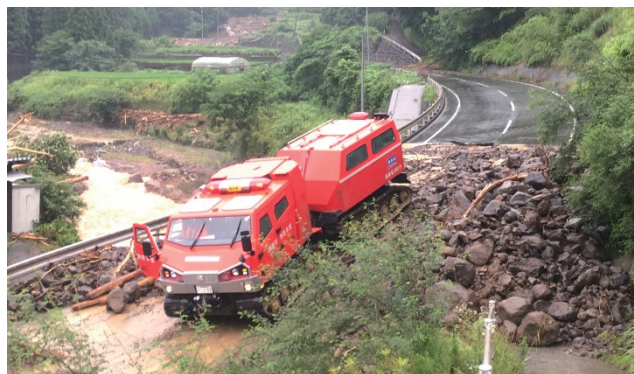
全地形対応車による孤立地域への進入