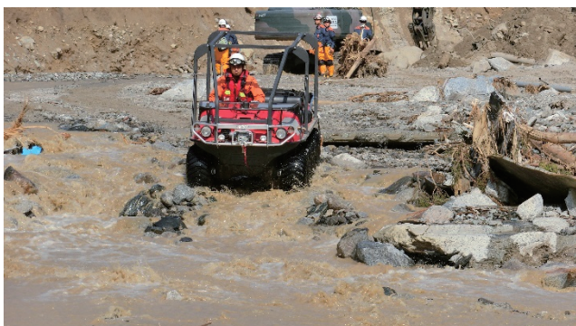
水陸両用バギーによる捜索・救助活動

中津市や日田市においては、河川の氾濫や土砂崩れにより発生した孤立地域に、水陸両用バギーなども活用しながら進入し、安否確認を含め捜索・救助活動を広範囲に実施した。