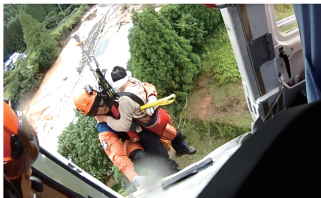
ヘリコプターのホイストによる救助

さらに、愛知県大隊の全地形対応車が、土砂等が堆積した道路障害も乗り越え、孤立地域への効率的な進入を図った。