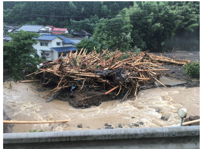
日田市 土砂、流木等の流入により全壊した住宅