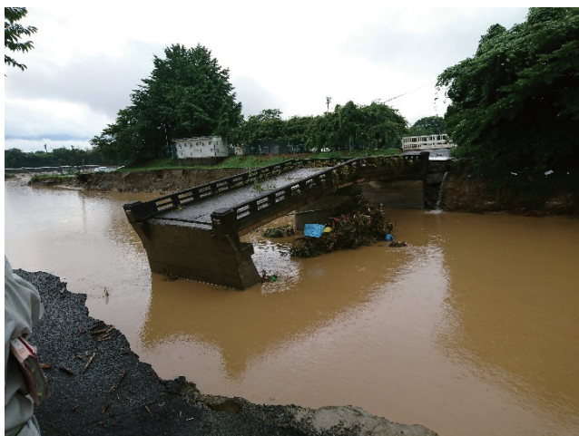
朝倉市 流失した橋

また、山腹崩壊及び土石流の発生に伴い大量の流木が下流に流れ、通行障害の一因となったほか、土砂とともに住家に流入するなどして多大な被害をもたらした。