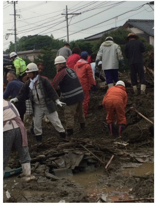
消防団の活動（朝倉市消防団）

岡山県、広島県、山口県、香川県、高知県、佐賀県、長崎県及び熊本県）延べ2,562隊、9,166人となった。また、活動のピークは、7月11日で、170隊、627人であった。