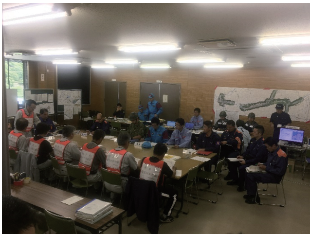
指揮支援本部(朝倉市役所)

また、消防庁と独立行政法人宇宙航空研究開発機構(JAXA)との「消防防災における航空機の利用に関する技術協力の推進に係る取り決め」に基づき、消防庁がD-NET(災害救援航空機情報共有ネットワーク)を活用し、福岡県災害対策本部と行方不明者の検索場所等の共有を図った。