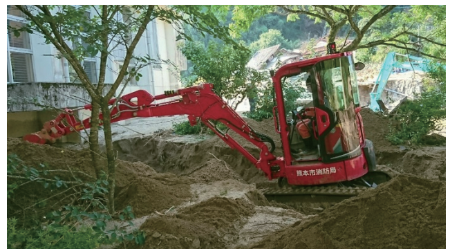
重機を使用した捜索・救助活動

陸上隊は、当初、広島県大隊、山口県大隊及び長崎県大隊が、東峰村にて、捜索・救助活動を実施した。その後、7月9日には東峰村の捜索・救助活動がおおむね終了したため、全ての県大隊は朝倉市へ部隊移動した。また、7月9日には愛知県大隊及び佐賀県大隊が、7月10日には熊本県大隊が大分県から部隊移動し、朝倉市にて捜索・救助活動を実施した。7月25日には、朝倉市での捜索・救助活動がほ